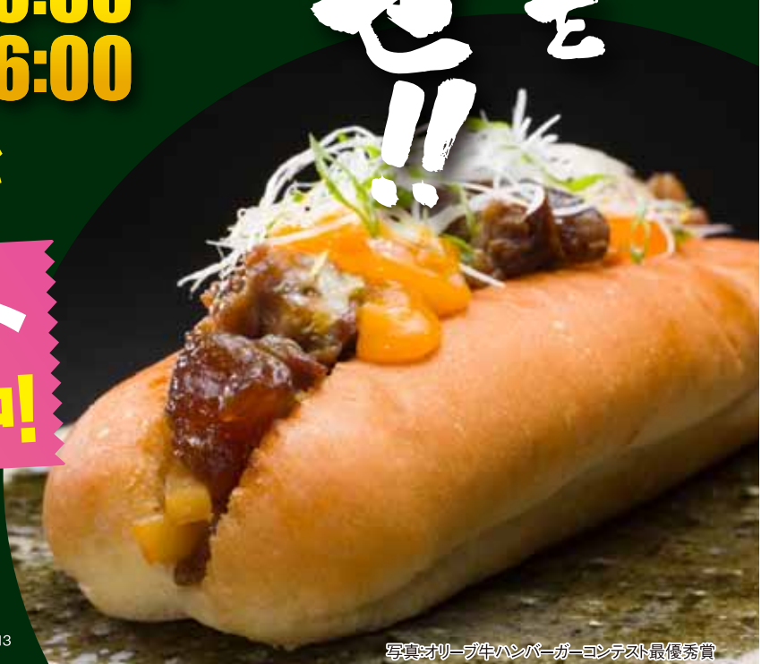
写真:オリーブ牛ハンバーグコンテスト最優秀賞

1,000円 税込 チケット 好評発売中! ドリンク1杯 サービス付! ドリンクは【ビール・ノンアルコールビール・ジュース】の中からお選びいただけます。